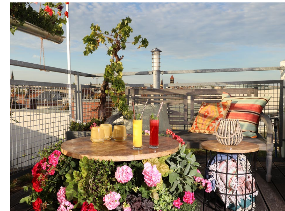
Eine blühende Terrasse hoch über den Dächern der Stadt. Es gibt wohl kaum einen schöneren Ort, um den Sommer in der City zu geniessen.

WER EINEN BALKON MIT BUNTEN PFLANZEN UND ATTRAKTIVEN GEFÄSSEN GESTALTET, SCHAFFT EINEN ZUSÄTZLICHEN LEBENSRAUM. SOLCH HOCHWERTIGE UND INDIVIDUELLE WOHLFÜHLOASEN BIETEN ERHOLUNG UND ENTSPANNUNG AUF KLEINSTEM RAUM.