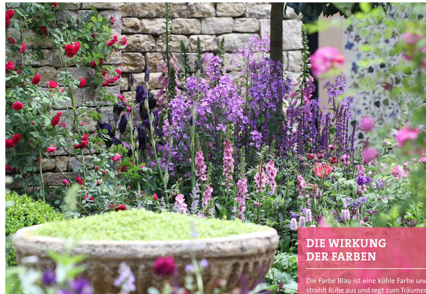
Ein Feuerwerk der Farben.

ZENTRALES GESTALTUNGSELEMENT BEI SOMMERBLUMENBEPFLANZUNGEN SIND DIE FARBEN. SIE STEHEN FÜR LEBENDIGKEIT UND BEEINFLUSSEN DIE RÄUMLICHE WAHRNEHMUNG.