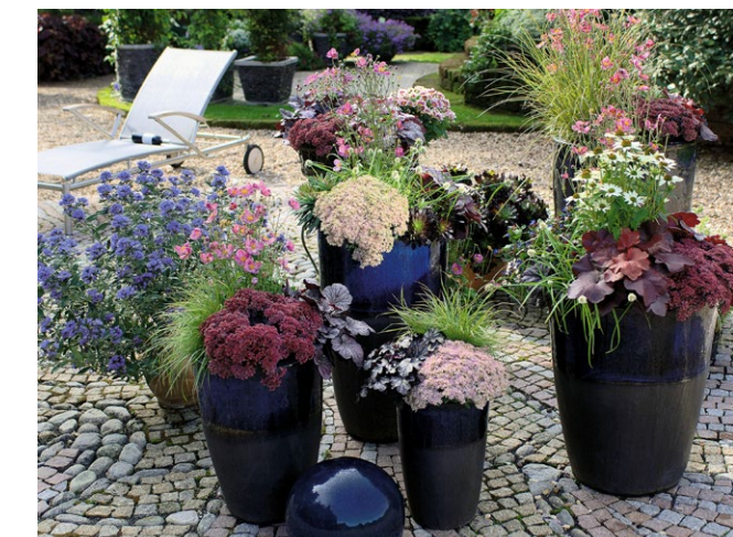
Eine bunte Farbpalette im Topfgarten.

Es ist zudem nur sinnvoll, Pflanzen mit gleichen Standortansprüchen zu kombinieren. Die Akzente setzen attraktive Blüten und moderner Blattschmuck.