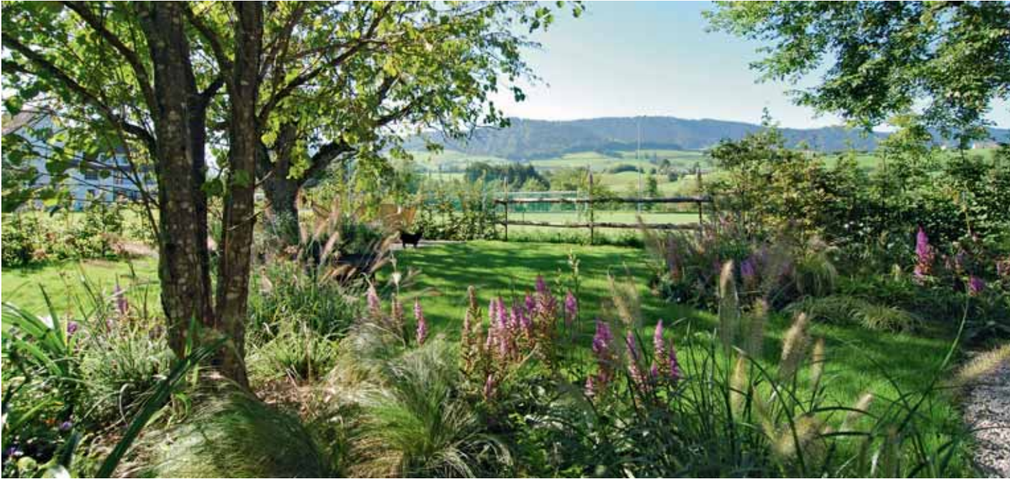
Grossartige Gartenanlagen beruhen auf einer professionellen Planung.