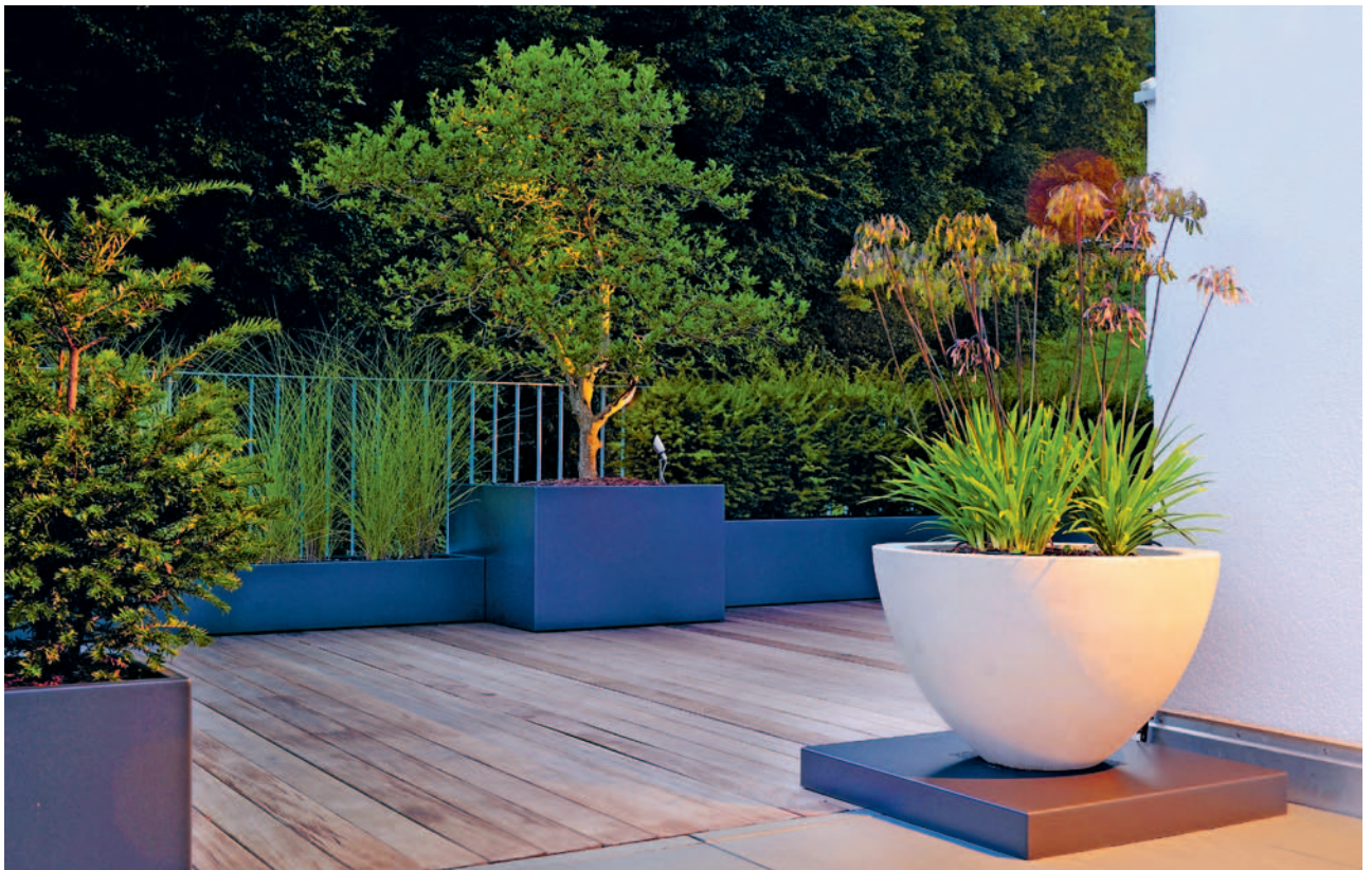
Der Aussenraum sollte nicht überladen wirken, gleichzeitig aber die gewünschte Stimmung ausdrücken.

Eine grosse Herausforderung bei der Gestaltung von kleinen Gärten ist es, möglichst viele Bedürfnisse anzusprechen und dabei trotzdem die Grosszügigkeit der Anlage wirken zu lassen. Gerade in solch kleinen Gärten ist es wichtig, eine Privatsphäre zu schaffen und so Gartenräume entstehen zu lassen, die den Gartenbesitzern das Gefühl von Geborgenheit geben.