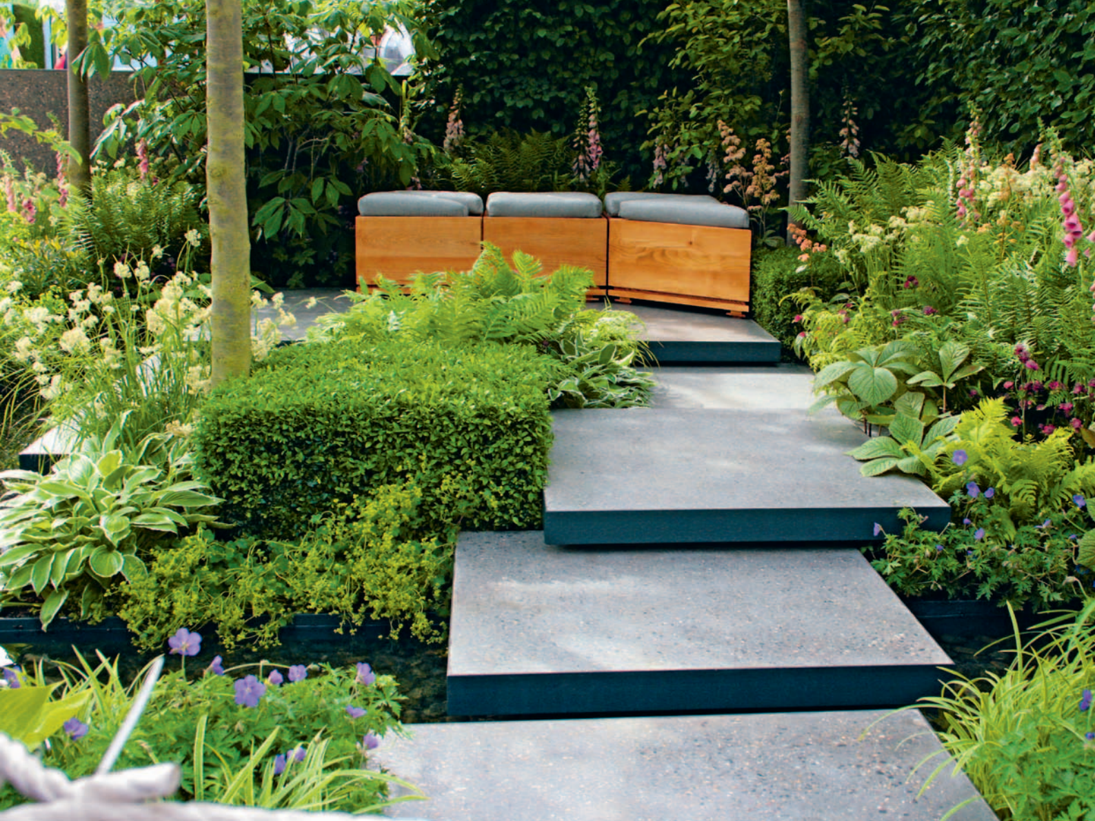
In kleinen Gärten ist die Gestaltung mit verschiedenen Ebenen sehr beliebt und trägt wesentlich zur Attraktivität begrenzter Flächen bei.

den Garten, sondern auch Pergolen und Laubengänge, die von Kletterpflanzen umschlungen werden. Letztere bilden fantastische Raumteiler. Was ihren besonderen Reiz ausmacht, ist der kleine Streifzug, zu dem sie den Besucher verlocken und ihm unterwegs immer wieder Einblicke in den Garten gewähren.