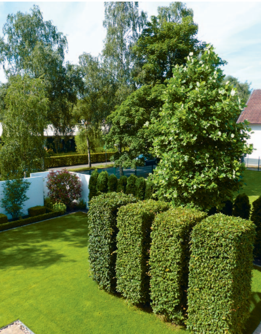
Harmonie kann auch ein Gefühl von Grosszügigkeit vermitteln.

Ein Gefühl von Grosszügigkeit vermittelt aber auch die dritte Dimension. In kleinen Gartenräumen sind Höhenunterschiede daher besonders wichtig. So kann der Gartenbesucher bereits mit zwei bis drei Treppenstufen die Ebene wechseln, zu einem erhöhten oder abgesenkten Ort gelangen und damit einen klar abgegrenzten, neuen Raum betreten. Aber nicht nur ein abgesenkter Sitzplatz oder ein erhöhtes Wasserbecken bringen gewollte Spannung in